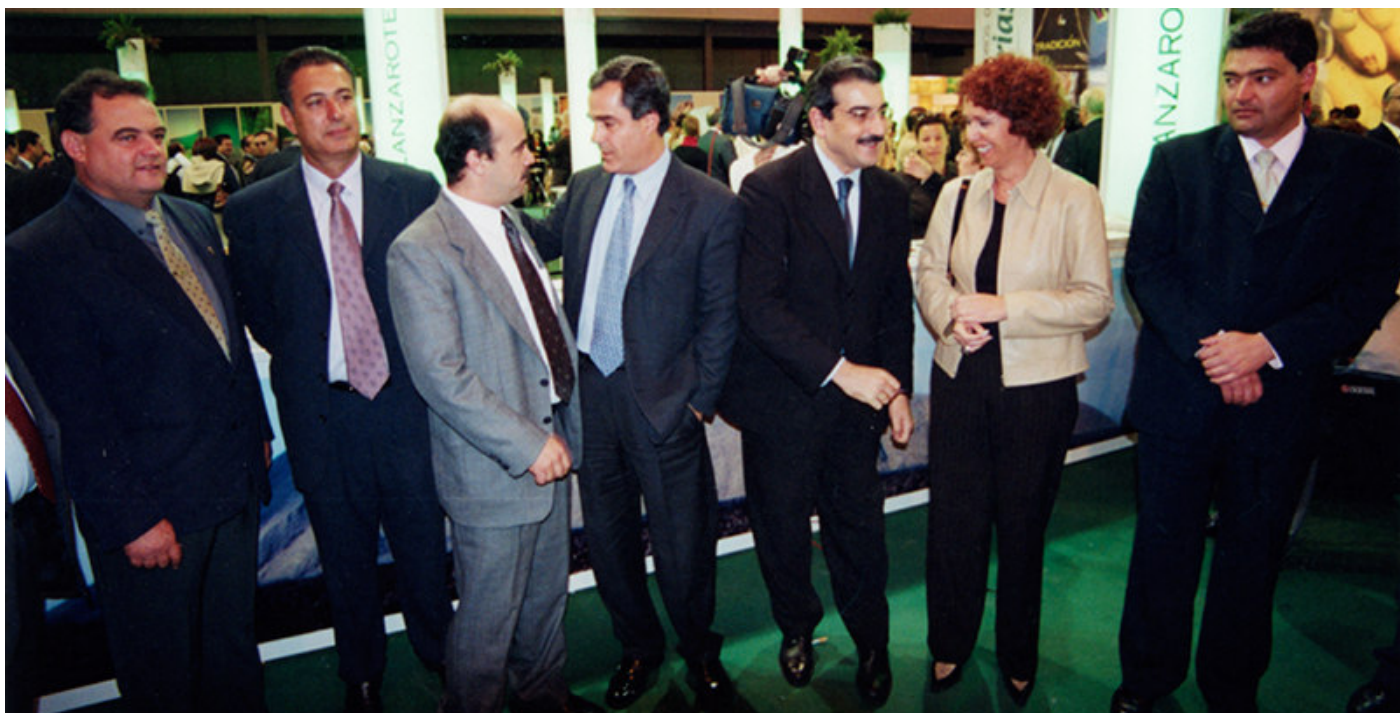
Lancelot formó parte, como creador de opinión, del desarrollo político de la isla de Lanzarote.