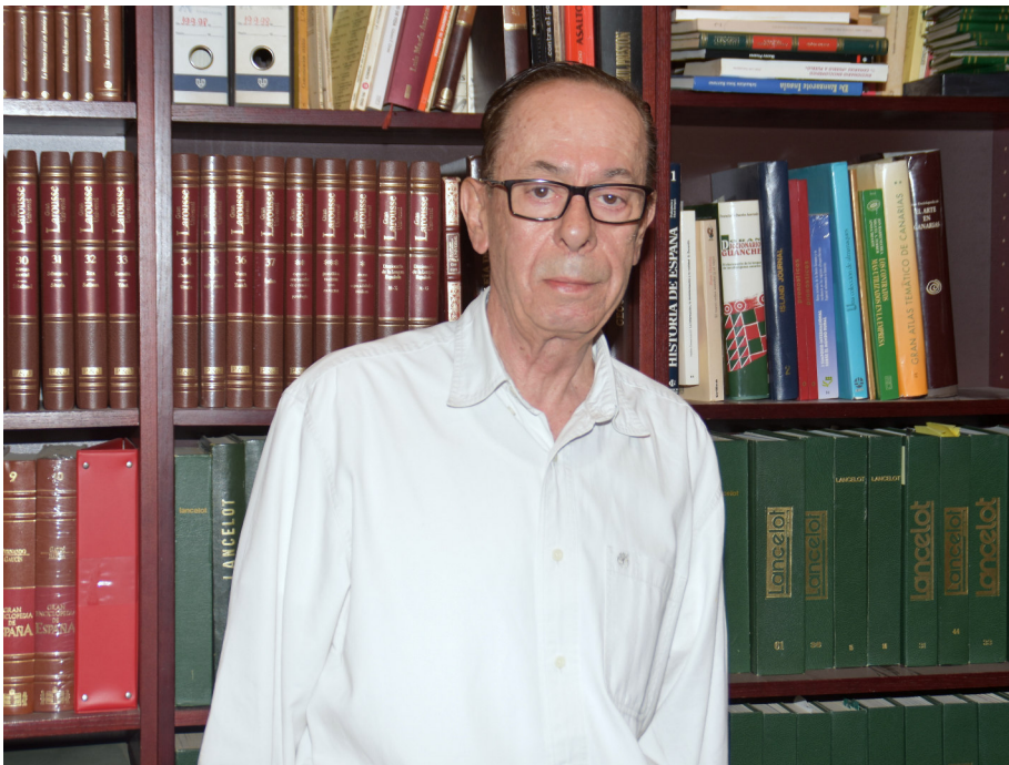
El fundador de Lancelot recuerda nítidamente los comienzos de la revista, una época dura pero inolvidable para él.

“ El periodismo en Lanzarote goza de muy buena salud y, en general, ofrece calidad y credibilidad”