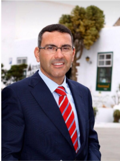
Oswaldo Petancort García Alcalde de Teguiise